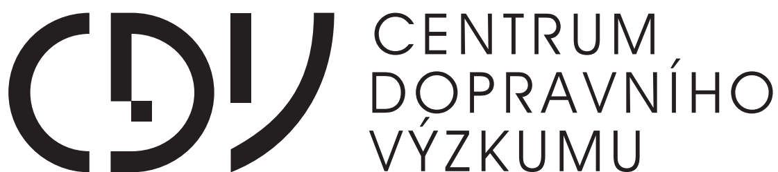
Černá varianta loga