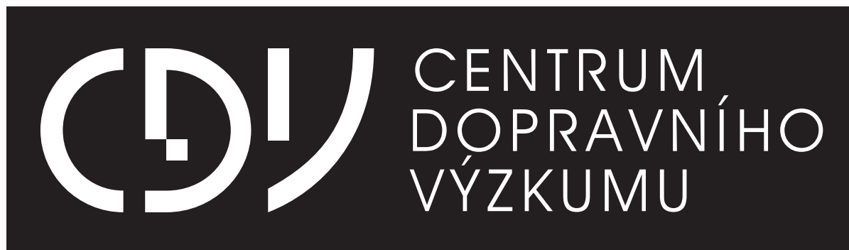
Negativní bílá varianta loga