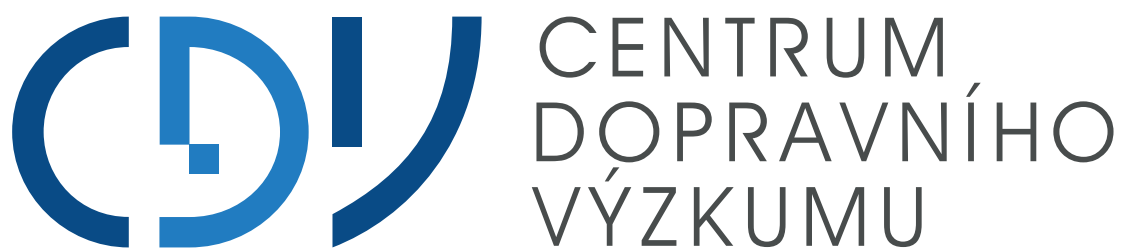
Základní barevná varianta loga