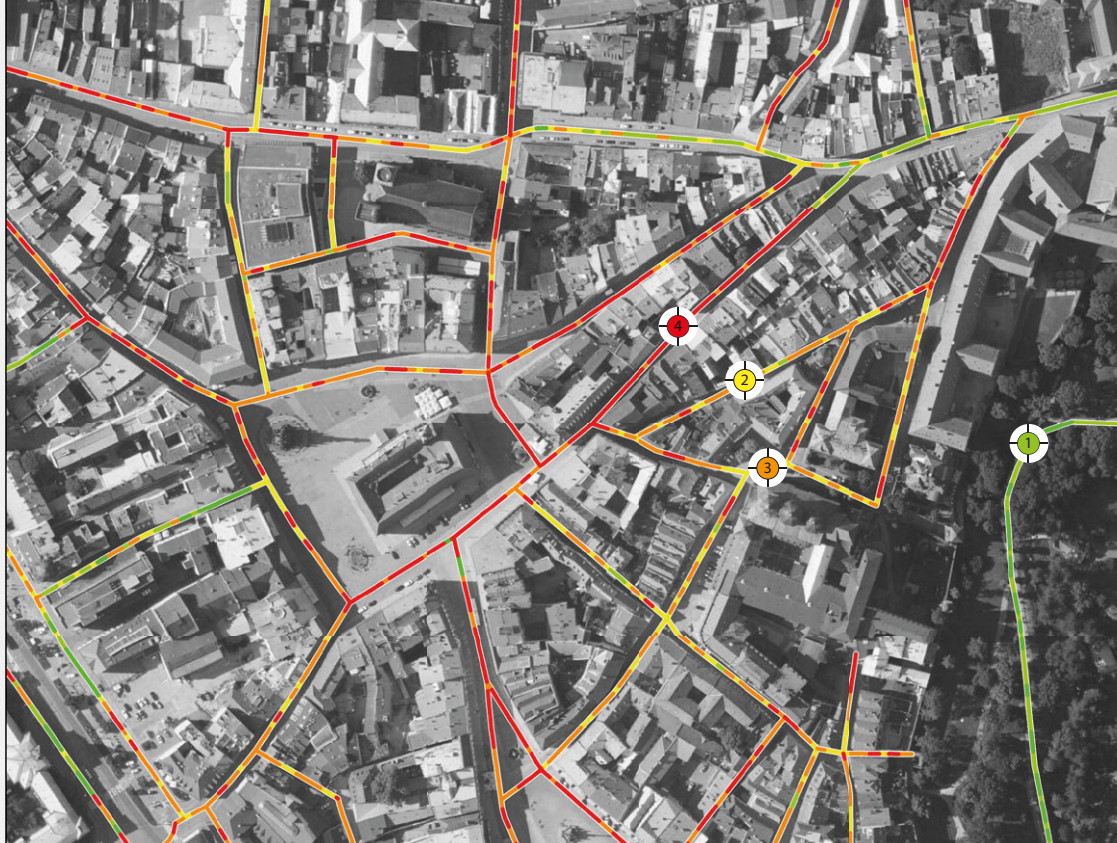
Mapa dynamického komfortu